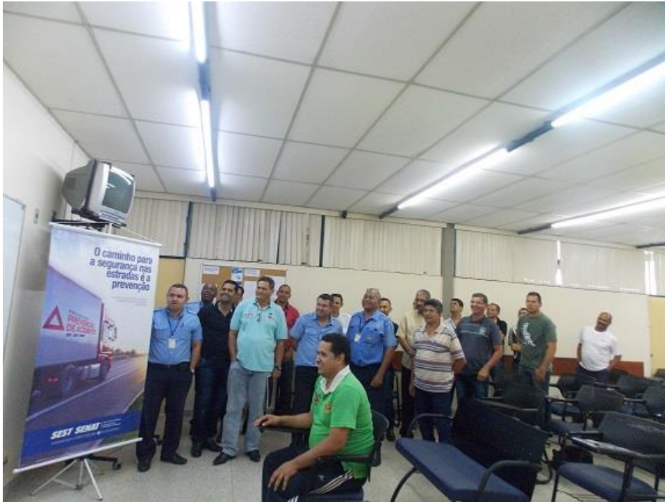
Figura 1: Dinâmica de grupo durante treinamento