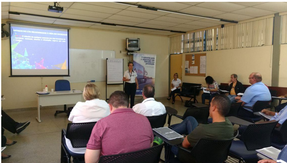
Figura 2: Conteúdo expositivo durante treinamento

Além de oferecer os conteúdos complementares para os instrutores do SEST/SENAT, a equipe pedagógica da EMDEC acompanhou as primeiras turmas e apresentou alguns conteúdos, a fim de alinhar os discursos e oferecer todo o suporte necessário para a contextualização do curso à realidade de Campinas.