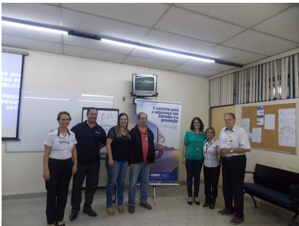
Figura 3: Equipe EMDEC e SEST/SENAT

O oferecimento das turmas teve início em janeiro de 2018 e se estendeu até o primeiro trimestre de 2019 para dar conta da demanda do sistema. Desde então, são oferecidas turmas mensais para treinar os novos motoristas e a EMDEC faz contato periódico com as empresas de ônibus para garantir sua participação.