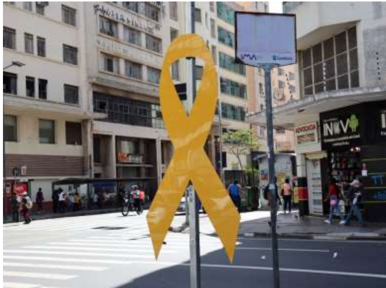
Figura 3 - Laço instalado no Largo do Rosário

A tabela que você vê abaixo foi elaborada com a intenção de sistematizar os diferentes elementos contextuais que foram narrados na web série. A seleção dos componentes foi