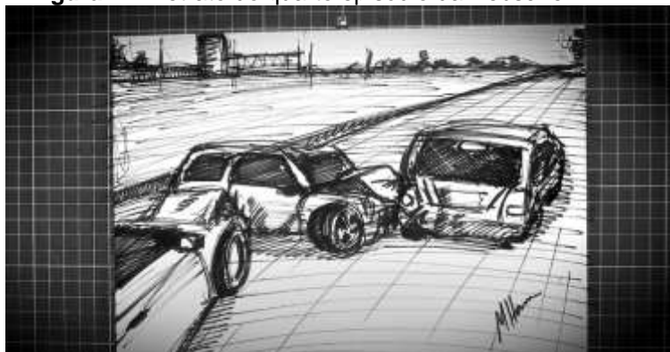
Figura 2 – Retrato do quarto episódio da websérie.

A tônica dos primeiros capítulos é destinada a ilustração do cenário de ocorrências sinistras de trânsito na cidade, dando destaque para as vias artérias do município: John Boyd Dunlop, Avenida das Amoreiras, Prestes Maia, Francisco Glicério e San Conrado. Esses dados permitem a elaboração de um recorte geográfico sobre os sinistros de trânsito em Campinas, eles se concentram em áreas de intenso tráfego de veículos, em vias arteriais que conectam diferentes regiões do município e são usadas para o deslocamento dos moradores da cidade e adjacências. Para os primeiros episódios, cinco laços foram colocados perto dos locais das ocorrências retratadas na série (figura 3). No laço, há um QR Code, para que os munícipes apontem o celular e acessem a página da Série .