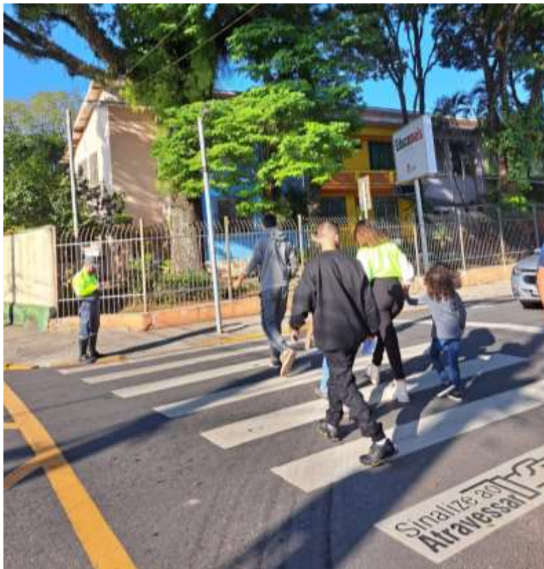
Figura 1. Agente de Mobilidade Urbana coletando informações para Notificação Cidadã

A "Notificação Cidadã" é uma estratégia de educação colaborativa que utiliza o reforço positivo como abordagem principal. Os Agentes de Mobilidade Urbana realizam observações em campo (Figura 1) e registram informações sempre que flagram um condutor respeitando as normas viárias e priorizando a segurança de pedestres. Como reconhecimento, o condutor recebe a "Multa do Bem" em forma de uma notificação formal.