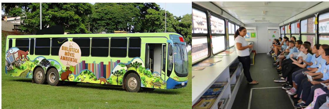
Projeto Biblioteca Móvel, 2017

A Biblioteca Móvel é outro projeto, em que um ônibus adaptado e cedido pela Viação Garcia, com livros e mobiliários para leitura e atividades lúdicas, visita as escolas municipais em todas as regiões de Londrina (PR).