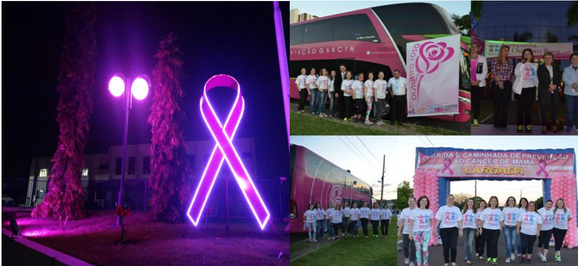
Outubro Rosa, 2016

A difusão da cultura, incentivando a educação e cidadania, também integra o rol de iniciativas sociais que a Viação Garcia participa.