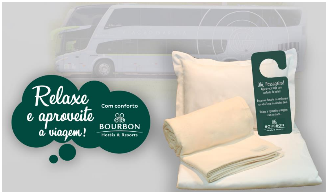
Publicidade Kit Conforto

As ações de marketing têm em vista levar ao passageiro a iniciativa inovadora da Viação Garcia, na parceria com o Bourbon Hotéis & Resorts, visando o conforto, a comodidade e a segurança do serviço ofertado.