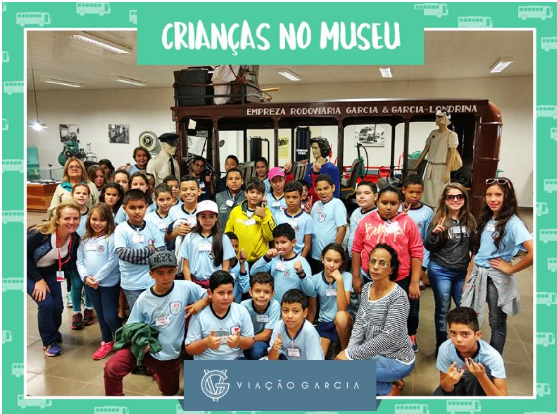
Projeto Criança no Museu, 2017

A empresa encabeça o Projeto Crianças no Museu, que fornece transporte gratuito semanalmente para escolas da rede pública de Londrina (PR) para que seus alunos visitem o Museu Histórico da Viação Garcia, na sede da empresa.