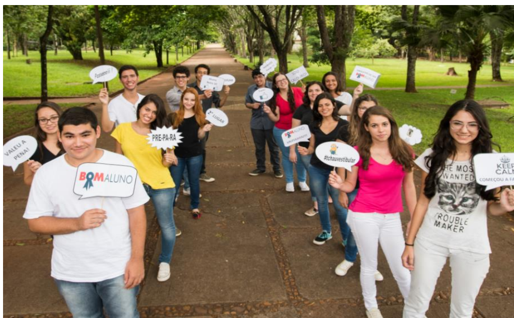
Projeto bom aluno

A Viação Garcia é uma das mantenedoras do Programa Bom Aluno, o objetivo do projeto é incentivar os estudos para alunos de baixa renda.