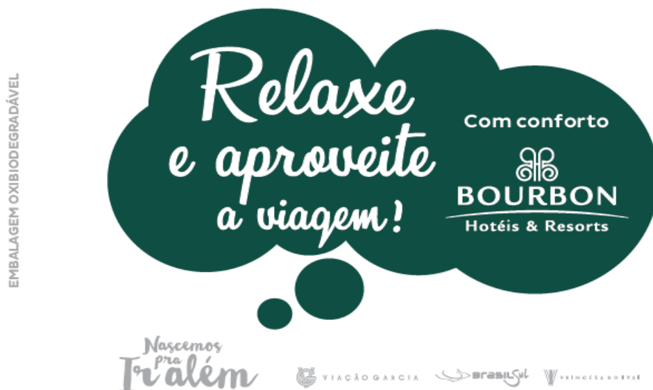
Embalagem Kit conforto

Ao final da viagem, deixe sobre a poltrona. Obrigado.