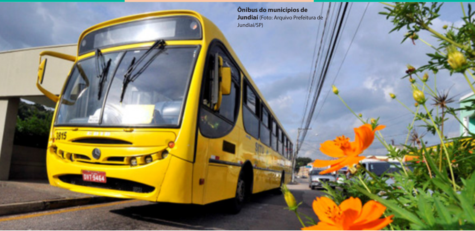
Ônibus do municípios de Jundiaí