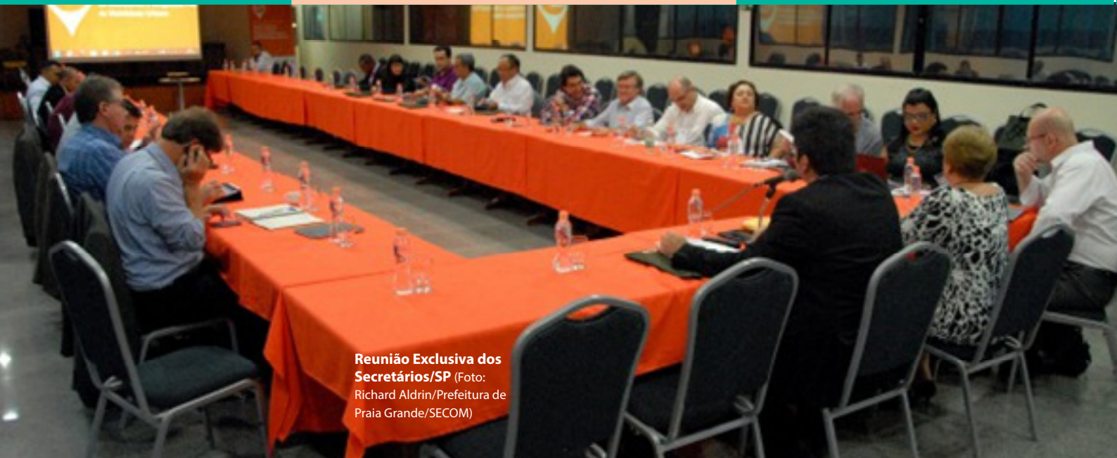
Reunião Exclusiva dos Secretários/SP