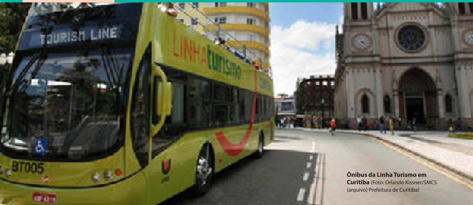
Ônibus da Linha Turismo em Curitiba